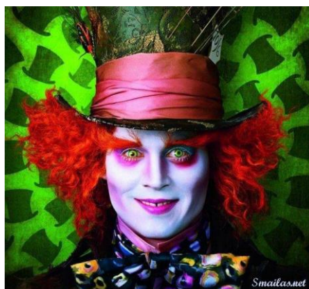
7 pav. Filme „Alisa Stebuklų šalyje“ Išprotėjusį skrybėlininką vaidino Johnny Depp